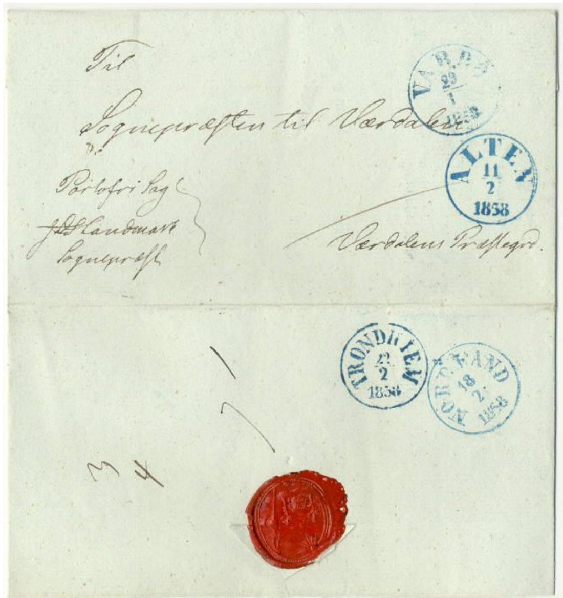
Brev fra VARDØ 23/1 1858 og sendt med vinterposten over vidda via ALTEN 11/2.