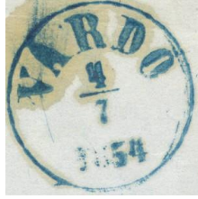
Preprim-stempel fra VARDØ 4/7 1854